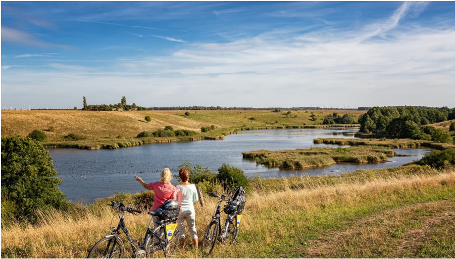
Oderbruchbahn-Radweg mit Blick auf die Lietzener Teiche, Foto:Seenland Oder-Spree e.V./Florian Läufer