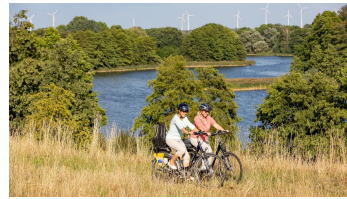
Oderbruchbahn-Radweg an den Lietzener Teichen