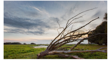
Landschaft Oderbruch