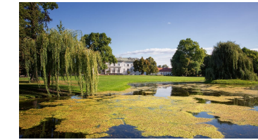
Schloss Neuhardenberg, Oderbruch