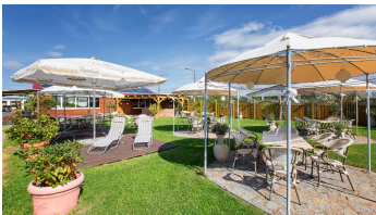
Oderbruch, Restaurant Juani