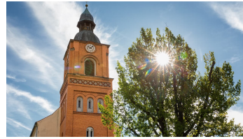
Buckow (Märkische Schweiz)