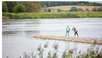
Oderbruch, Zollbrücke