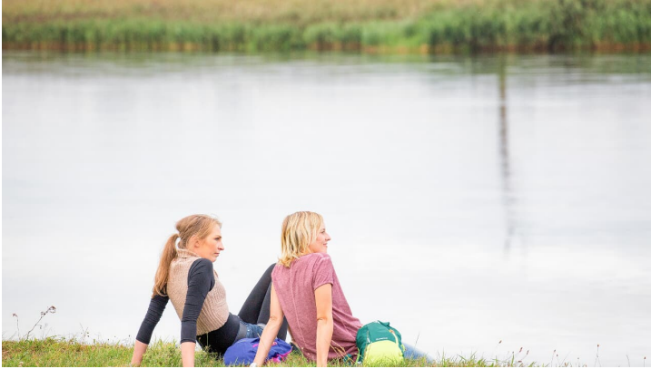
Groß Neuendorf