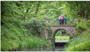
Schlosspark Steinhöfel