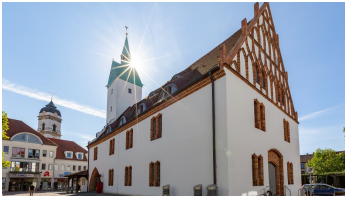
Altes Rathaus und Dom St. Marien Fürstenwalde