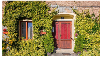
Buckow (Märkische Schweiz)