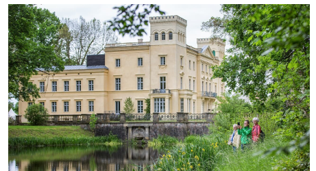
Schloss Steinhöfel