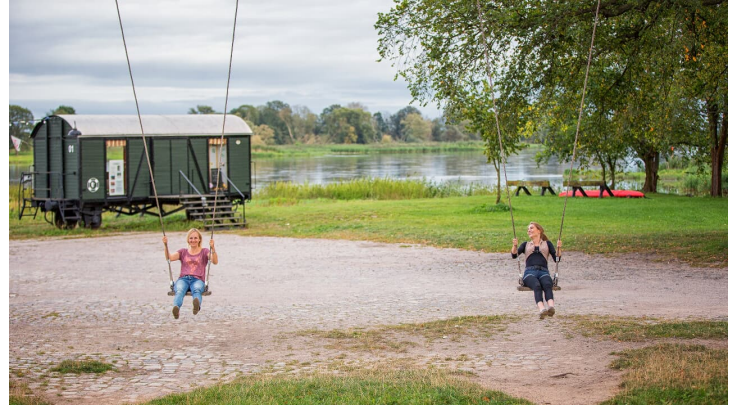
Groß Neuendorf