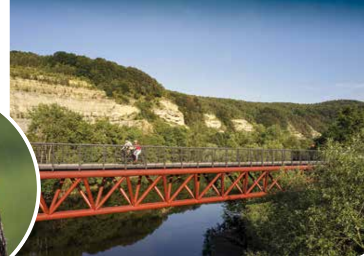
Werratal: Fahrt über die Werra mit Blick auf die Nordmannsteine