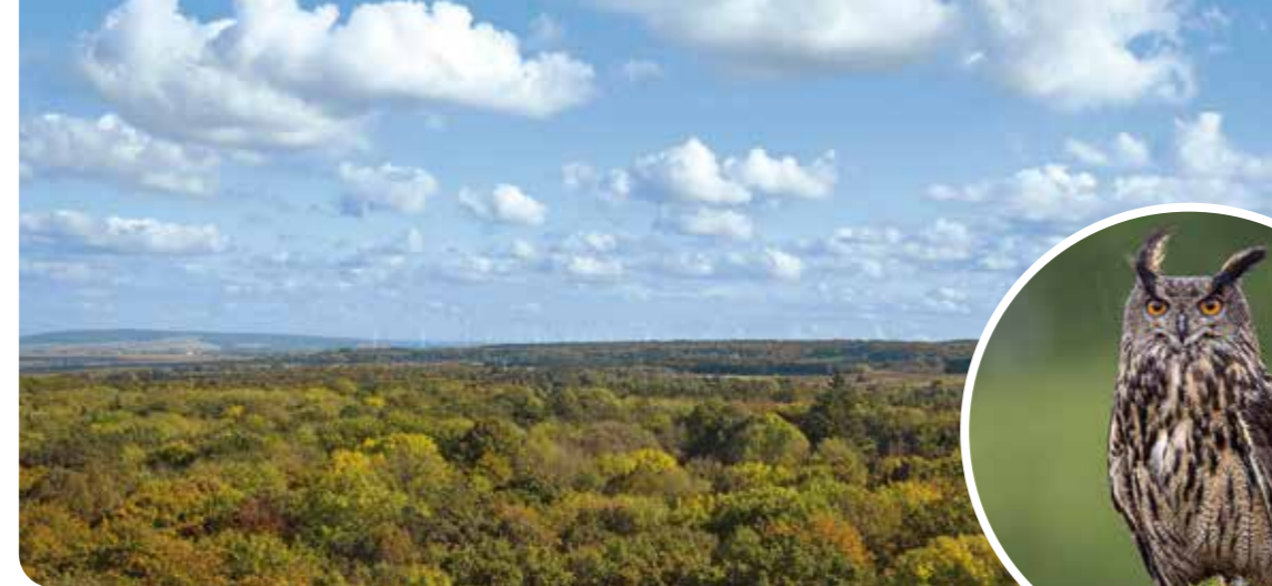
Hainich: Unendliche Waldlandschaft