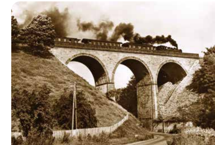
Unstrut-Viadukt bei Kefferhausen

Die Kanonenbahn Leinefelde-Eschwege war ein Teilstück der strategischen Eisenbahnlinie Berlin - Straßburg (Elsass-Lothringen), die nach dem Deutsch-Französischen Krieg 1870/71 sehr aufwendig gebaut und betrieben wurde. Bis 1880 waren die meisten Streckenabschnitte fertiggestellt und andere Bahnen wurden verstaatlicht, um die durchgehende Staatsbahnverbindung von Ost nach West zu schaffen. Die militärische Bedeutung der Bahnstrecke verlieh ihr den Namen Kanonenbahn. Heute ist dieser Abschnitt umgebaut zu einer Draisinenbahn, zu einem Rad- und Wanderweg, auf dem man ganz friedlich den Naturpark für sich „erobert“ kann.