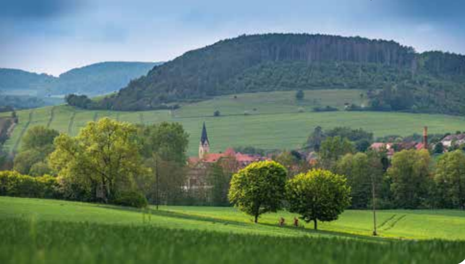
Eichsfeld: Blick auf Geismar