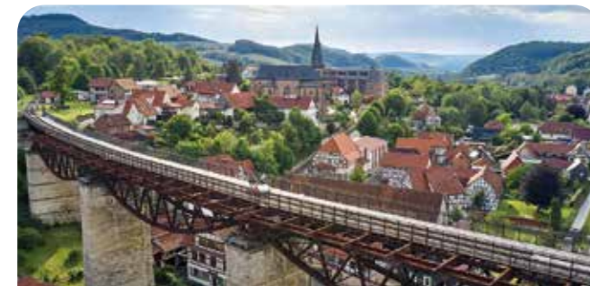
Unterwegs in der Draisine über das Viadukt

„Ich weiß nicht, dass ich schon jemals von der zauberhaften Schönheit eines Erdfleckens so innerlichst berührt worden wäre“, schwärmte der Schriftsteller Theodor Storm vor über 150 Jahren beim Blick von der Teufelskanzle über das Eichsfeld. Mittelalterliche Burgen, kunstvolle Wallfahrtskirchen und gepflegte Fachwerkdörfer sind Zeugen älterer und neuerer Geschichte. Allerorts kann man dem gelebten christlichen Glauben begegnen.