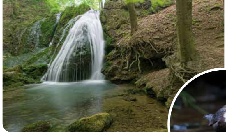
Lutterwasserfall bei Großbartloff