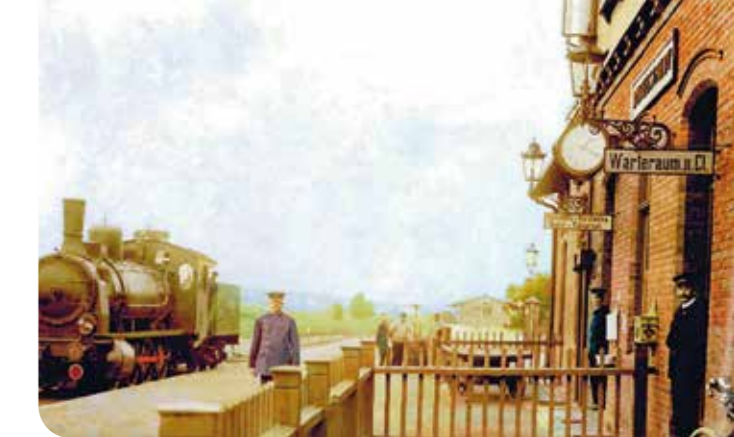
Bahnhof Dingelstädt um 1915